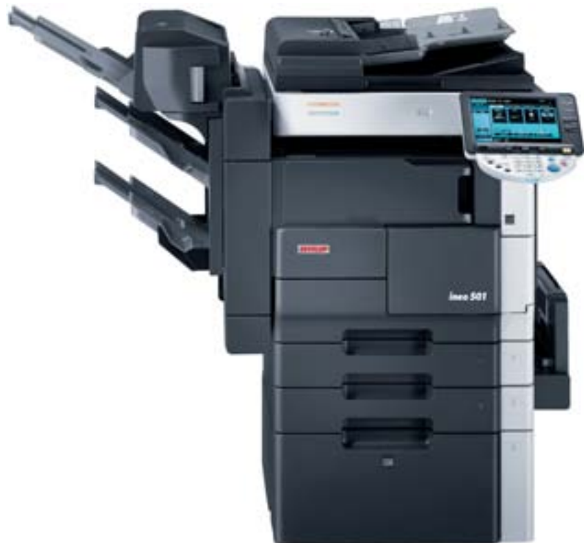
ineo 501 mit internem Finisher FS-522, Heft- und Falzeinheit SD-507 und Großraumkassette PC-407