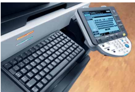
ineo 223 farbiges Touchscreen Display und optionale Tastatur für einfache Eingabe

Profitieren Sie von einem perfekten Team und nutzen Sie die ineo 223 für die Dokumentenproduktion in Schwarzweiß kombiniert mit den ineo+ Systemen für die Erstellung professioneller Farbdokumente.