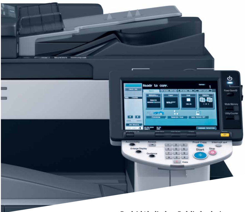
Das leicht bedienbare Farbdisplay der ineo 223

Die hohe Druckqualität in Verbindung mit einer großen Auswahl an Finishing-Funktionen ermöglichen es, selbst höherwertige Dokumente wie Broschüren inhouse zu drucken, zu lochen oder zu heften. Das steigert die Produktivität nachhaltig!