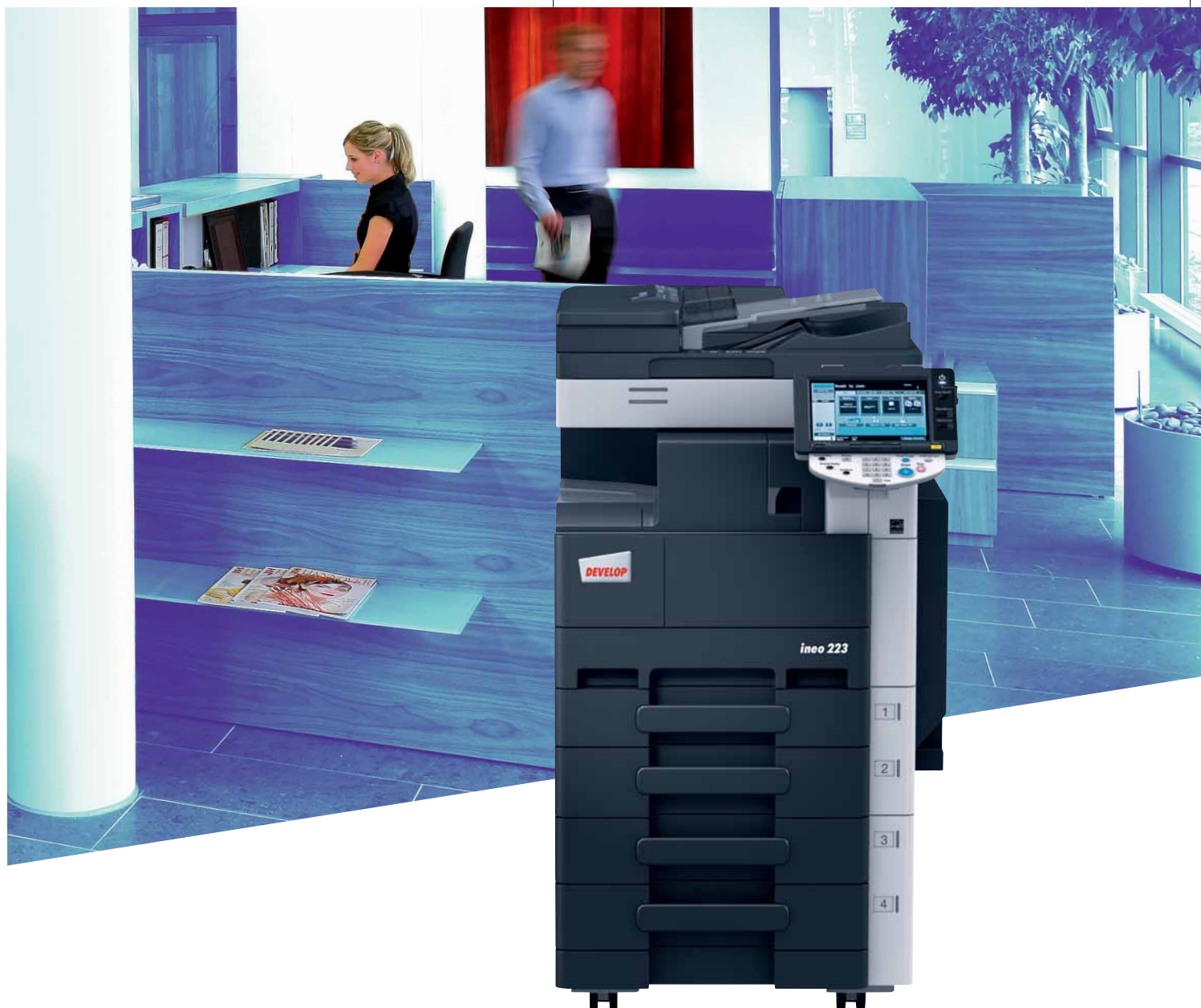
ineo 223 mit integriertem Heft-Finisher (FS-529), Papierkassette (PC-208) und Originaleinzug (DF-621)