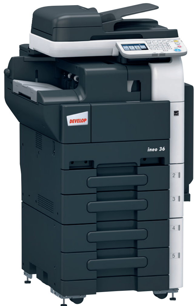
ineo 36 mit integriertem Finisher und zwei zusätzlichen Papierkassetten (2 x 500 Blatt)

Ob für Präsentationen, Handouts, mehrseitige Versanddokumente oder Rechnungen – Ihr Drucksystem verfügt über variable Endverarbeitungsfunktionen! Die ineo 36 bietet einen optionalen Heftfinisher, der Ihre Dokumente mit einer Klammer in der linken oberen Ecke oder mit zwei Klammern seitlich zusammenführt. Ein optisch ansprechendes Ergebnis in kürzester Zeit!